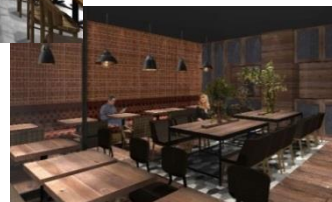
※店舗内観イメージ