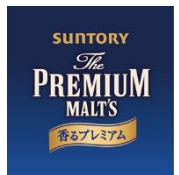
“プレミアムモルツ” “プレミアムモルツ 香るプレミアム”