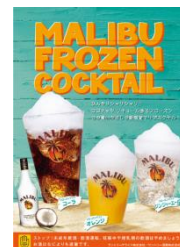
女性にも飲みやすい フローズンカクテル

4 月 21 日（火）～5 月 10 日（日）までオープニングフェア スタンダード飲み放題：男性 3,500 円 女性 3,000 円 プレミアム飲み放題：男性 4,500 円 女性 4,000 円 ※5 月 11 日（月）以降の毎週火曜日は“レディースデー”で女性限定 500 円引きとなります。